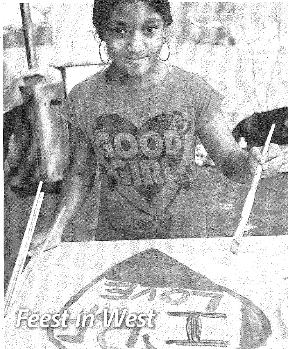
Dankzij de inzet van vele betrokkenen is het Burgemeester Meineszplein behoorlijk opgeknapt. Dat werd afgelopen weekend gevierd met het Baas in Eigen Buurt-festival. Er waren allerlei optredens, een markt en kinderactiviteiten. En het was hartstikke gezellig!

Meer informatie op www.femmesforfreedom.nl .